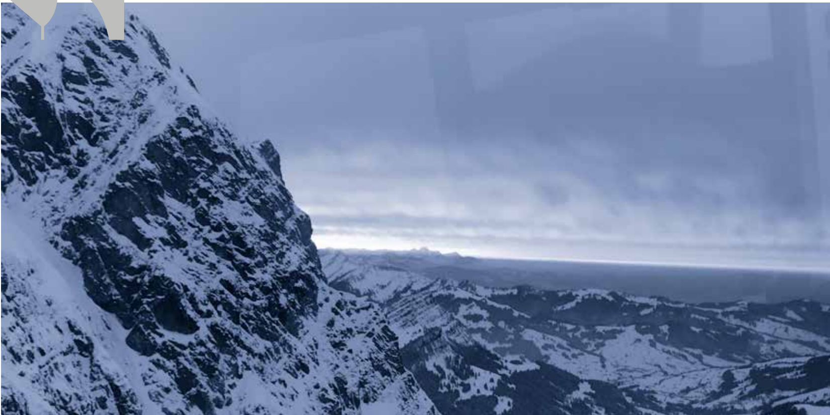
Mit den Besuchern aus Bossey auf den Säntis!