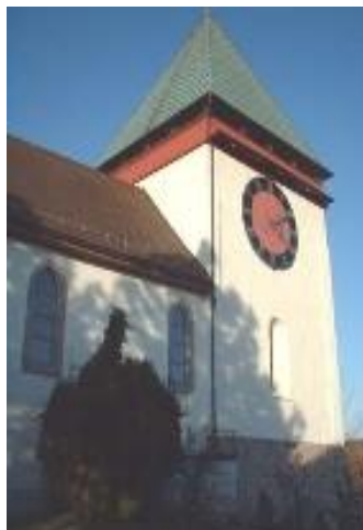
Ref. Kirche Illnau

Am nächstfolgenden Sonntag werden in den Gottesdiensten der reformierten und katholischen Kirchen die Namen derjenigen Gemeindemitglieder verlesen, die in der vergangenen Woche bestattet wurden; danach wird mit einem kurzen Trostwort für die Angehörigen der Verstorbenen gedacht.