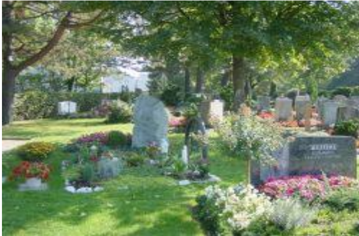
Friedhof Zelgli, Effretikon