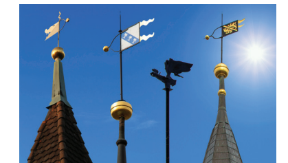
1 Gemeinde, 3 Kirchen und 1 Kapelle