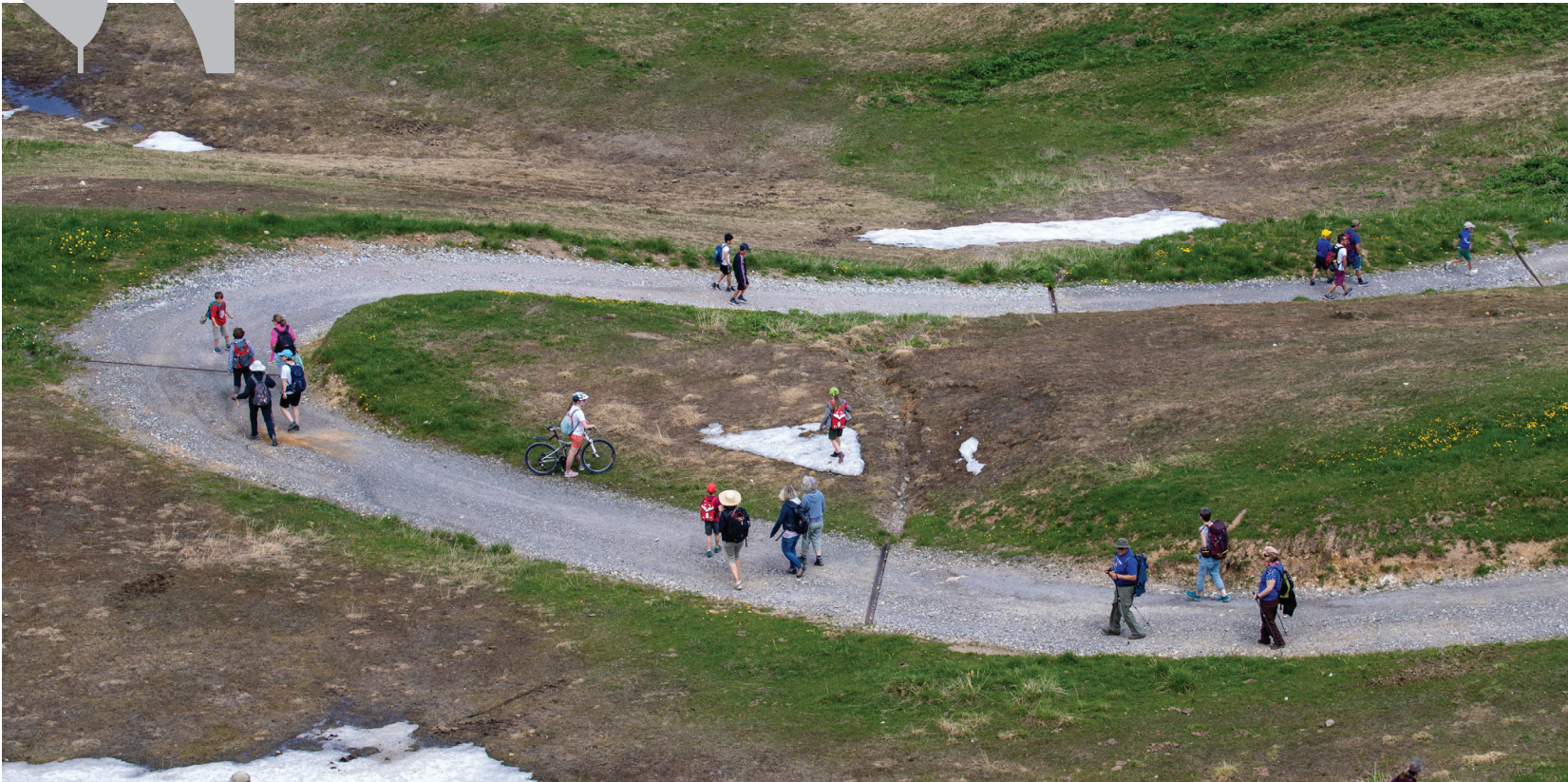
Mit verschiedensten Menschen unterwegs (Gemeindewochenende 2023)