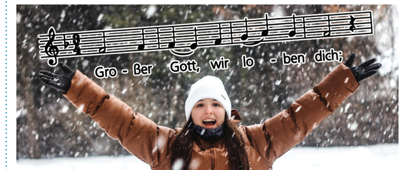
Wer hat Lust mitzusingen?