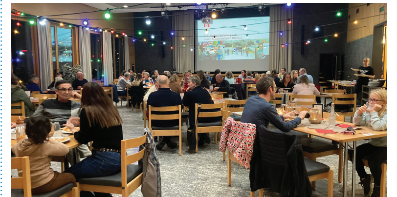
Volles Haus am Freitagabend im Pizzakurier-Bistro.