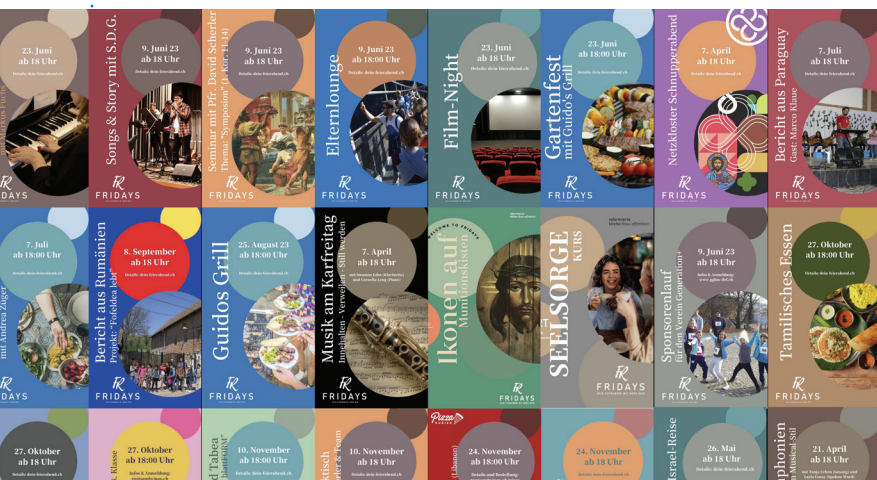
Vielfältiges Programm am FRIDAYS