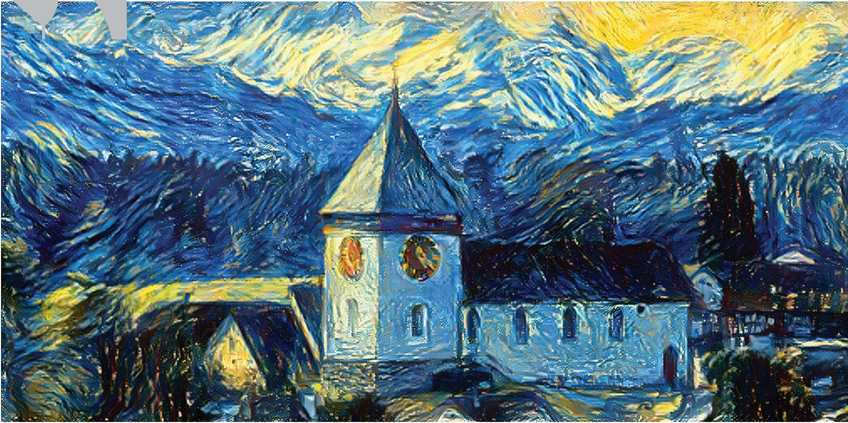
Wie hätte Vincent van Gogh die Kirche Illnau gemalt?