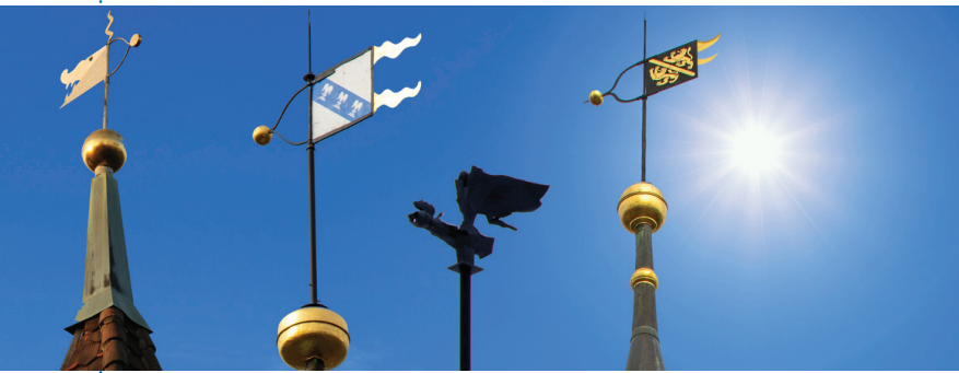
Welche Spitze gehört zu welcher Kirche?