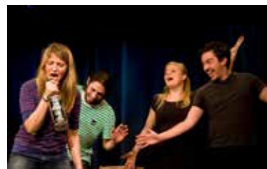
Die Gruppe Anundpfirsich