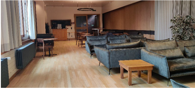
Der Bullingersaal wird zur Lounge