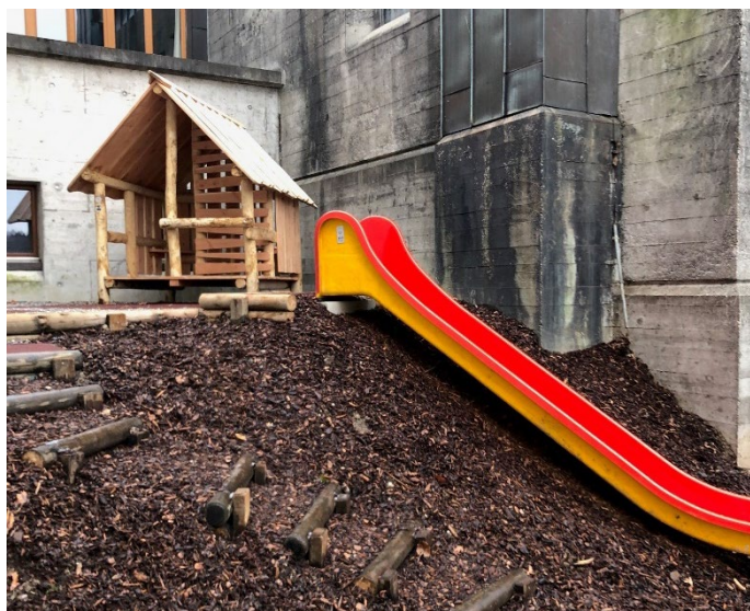
Eindrücke der beiden Aussenspielplätze beim Rebbuck