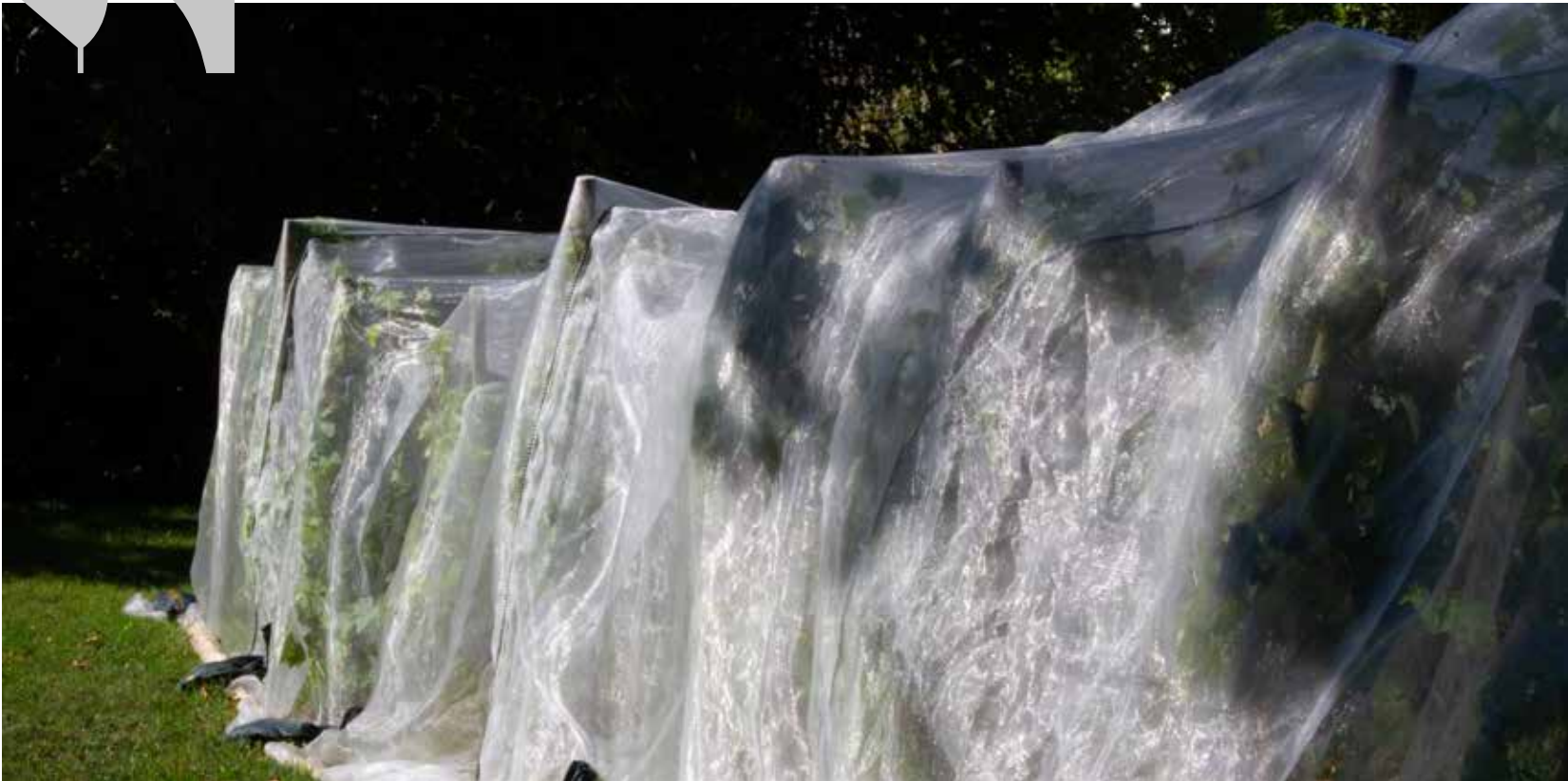
Gut geschützt reift unser Rebberg auf dem Rebbuck der Traubenlese entgegen.