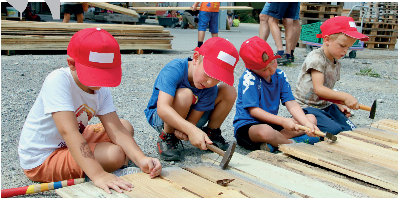
Viele kleine und grosse Baumeister helfen mit.