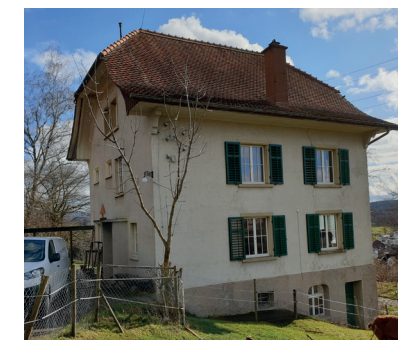
Haus Horn in Illnau