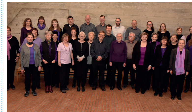
Die Sänger:innen des Gospelchors Illnau-Effretikon