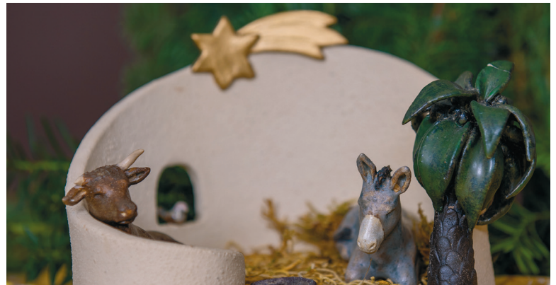
Bald füllt sich die Krippe wieder