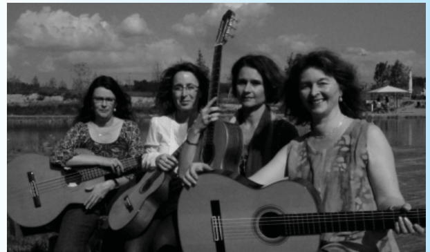
Donne & Corde Gitarrenquartett

Noch hat Wiesendangen Kyburg etwas voraus. Noch!