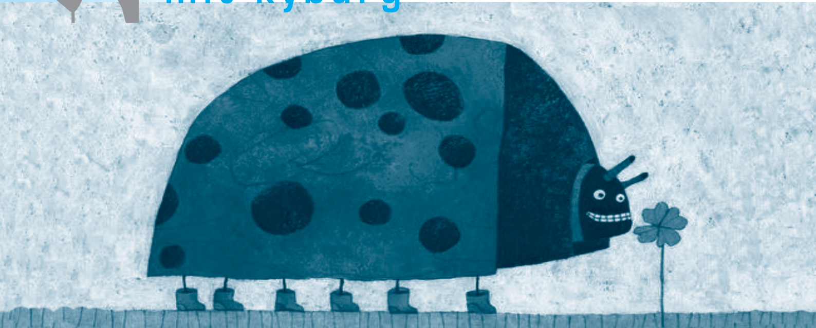
Ein vierblättriges Kleeblatt bringt Glück – und schmeckt ...