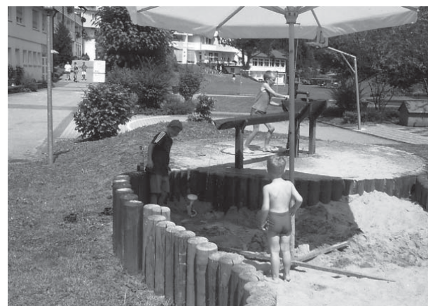
Spielwiese vor unserem Ferienzentrum

Die Gemeinschaft, die Natur, das gemeinsame Unterwegs-sein, zusammen feiern aber auch entspannen... Dies alles ist möglich in der Gemeindeferienwoche in Wildberg im Schwarzwald vom 9.-14. Oktober. Es hat noch schöne Zimmer frei, die wir nach Eingang der An-